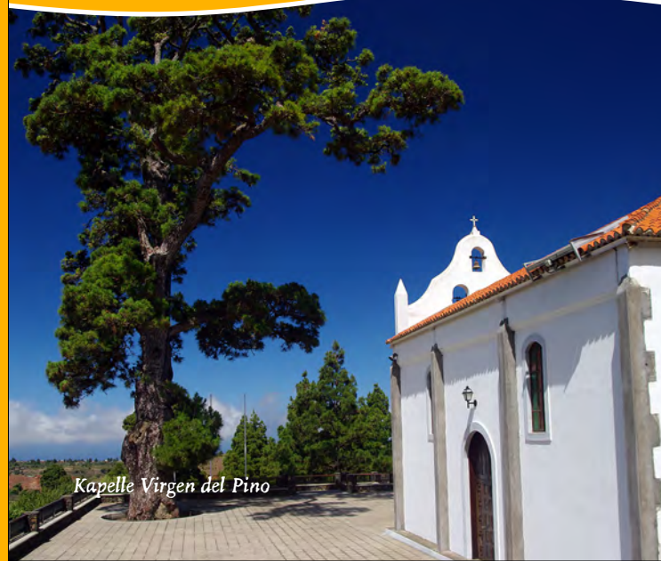
Kapelle Virgen del Pino